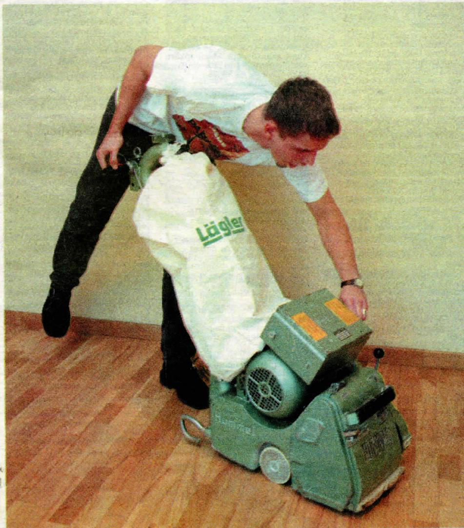
Kad parkets ieklāts, tas jāslīpē. Vēlams — ar kvalitatīvu mašīnu

Parketa dēlītim pie pamatnes jāturas stingri kā ortodoksālam komunistam pie pārliecības