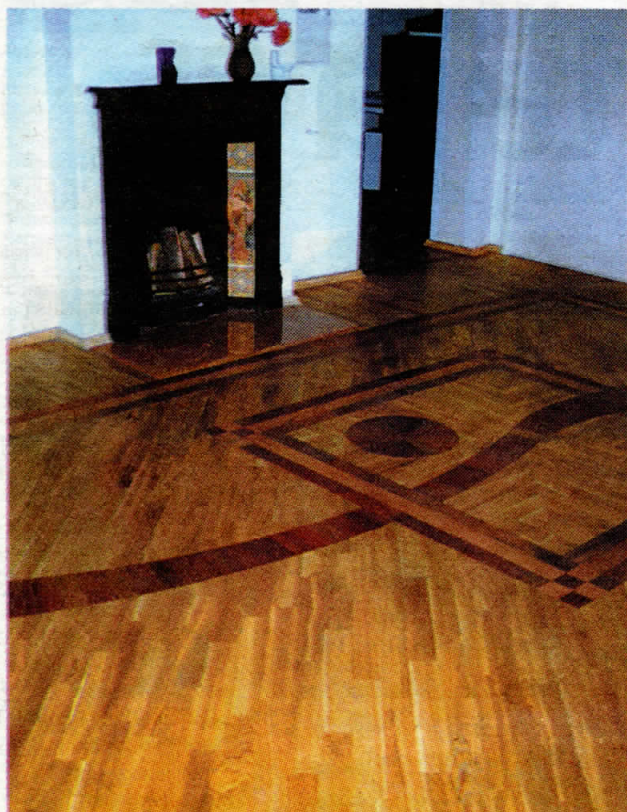
Parkets bez konservatīviem uzskatiem